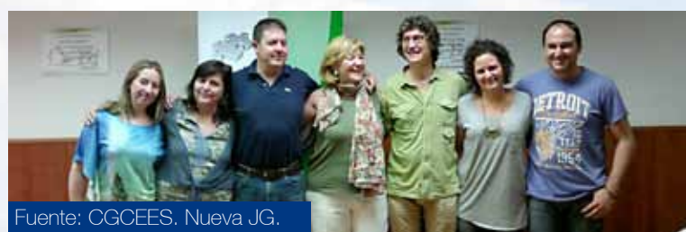
Fuente: CGCEES. Nueva JG.