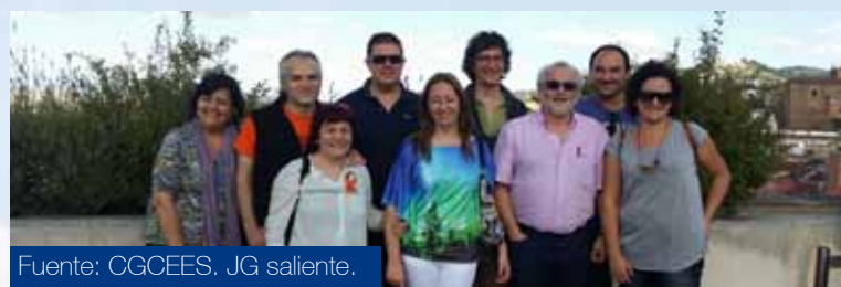
JG saliente.